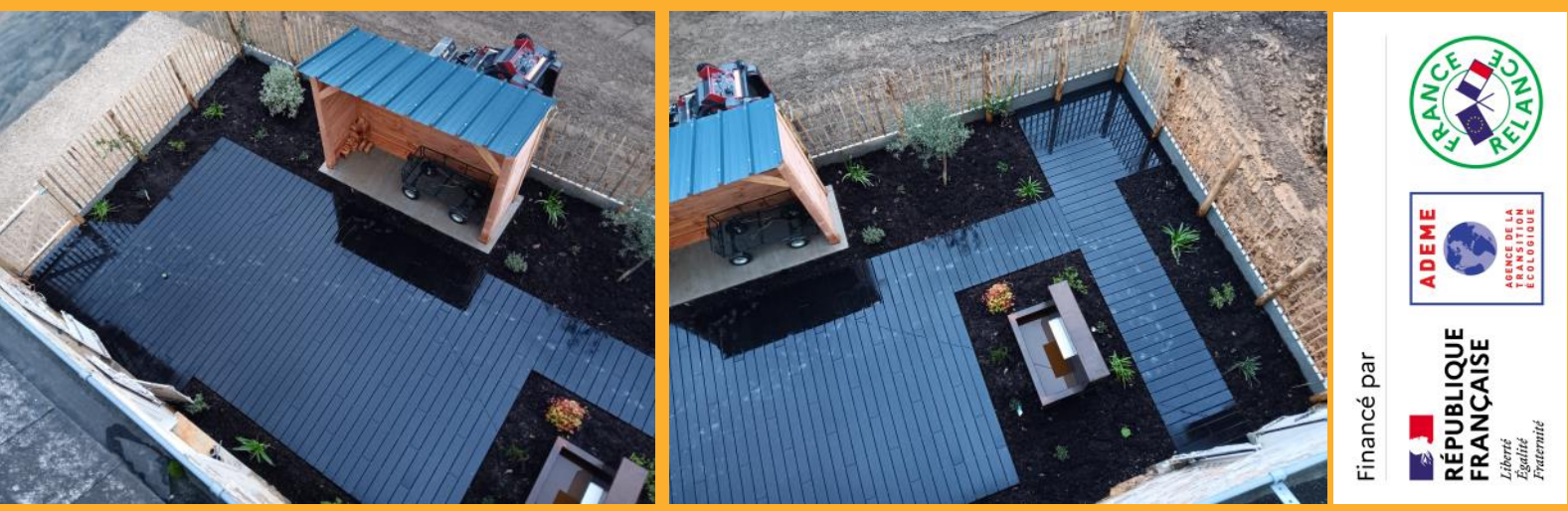
Vue aérienne de la nouvelle terrasse, à l'issue des travaux, décembre 2024...

Tant de travaux effectués pour aménager, agrandir, embellir, et préserver le bâti ancien que nous aimons restaurer selon les techniques ancestrales. Jusqu'à ces jours derniers ou, grâce au soutien financier de l'ADEME, nous avons pu aménager une nouvelle terrasse qui sera un coin de détente supplémentaire dès les beaux jours: écouter le bruit de l'eau, lire, siroter une limonade, respirer le parfum des fleurs... Tout en laissant désormais les eaux de pluie s'infiltrer dans la terre et en créant une climatisation naturelle de la maison.